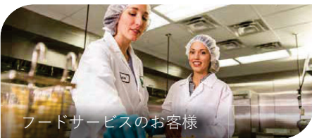
フードサービスのお客様